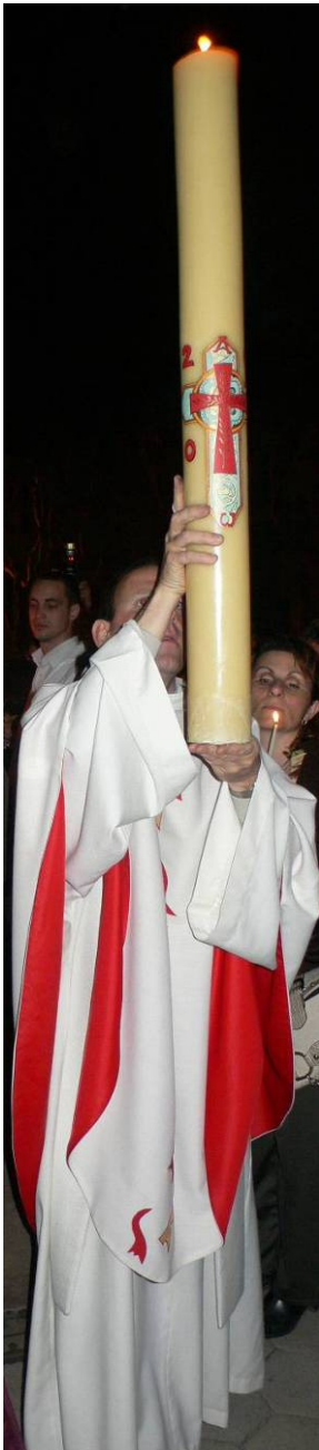
Vigile Pascale 2007