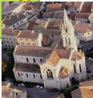
Notre Dame de Vie