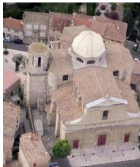
Notre Dame de l'Assomption