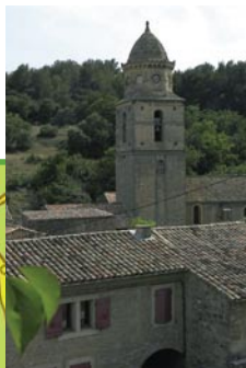
Notre Dame de l'Assomption