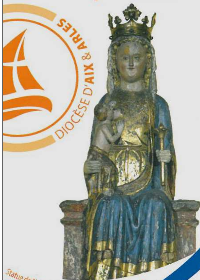
Statue de Notre-Dame de la Seds, Aix-en-Provence

pour confier à Marie l'avenir de notre Église diocésaine